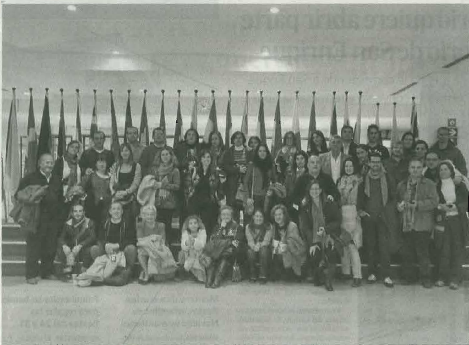
El grupo de alumnos y profesores en la sede de la Unión Europea en Bruselas.